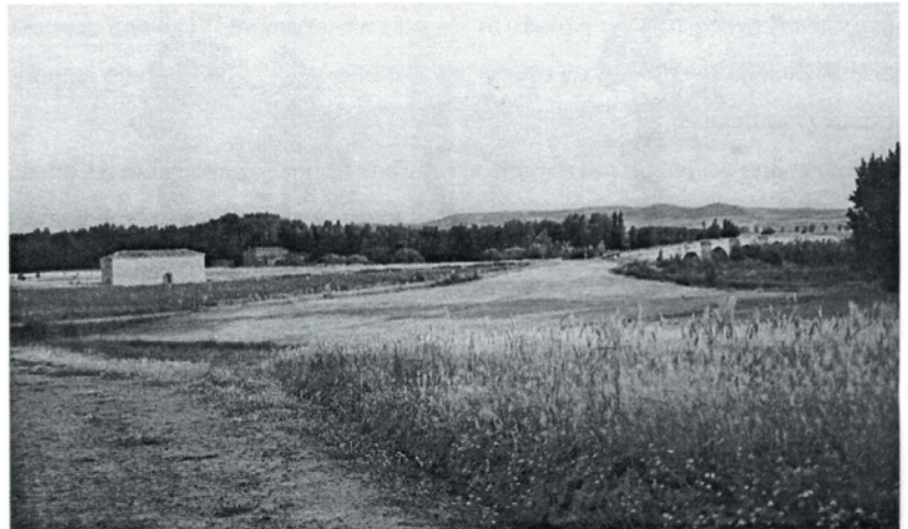
L'Hospital de San Nicolás, il Camino de Santiago e il ponte sul río Pisuerga.

Oggi San Nicolás è un piccolo, ma funzionale hospital del Cammino, forse uno