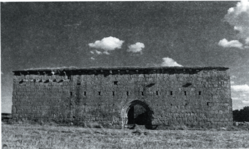
L'Hospital de San Nicolás prima dei restauri che ne hanno permesso il ripristino della funzione ospitaliera.