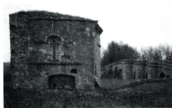
L'ermita di San Nicolás prima dei restauri.

Le rovine di San Nicolás - perché tali erano la pericolante cappella e i quattro muri perimetrali, privi di tetto, sopravvissuti - erano ciò che restava di un edificio medievale, più volte rimaneggiato ed ancora oggi di difficile lettura ed interpretazione.