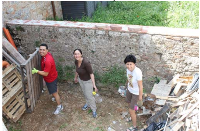
Il cortile pulito