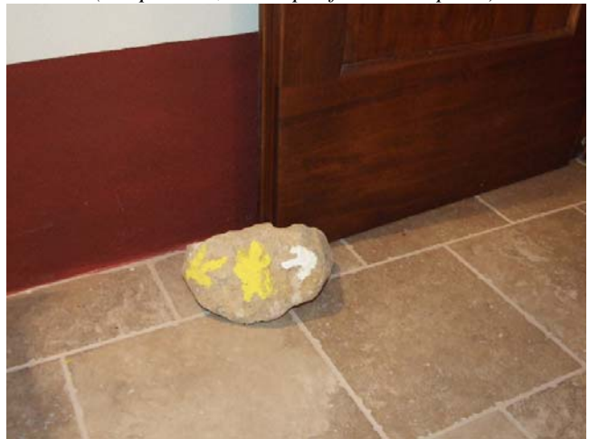
i segni di Via (sempre utili, anche per fermare le porte)