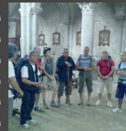
La preghiera nella chiesa cistercense di San Martino ai Monti