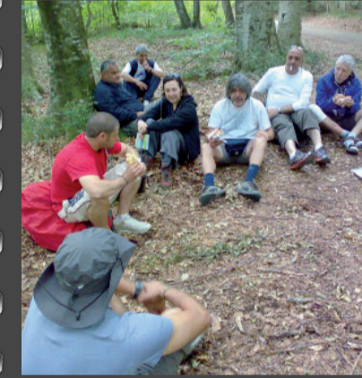
Un momento di meritata pausa in un bosco sui monti Cimini