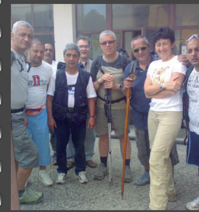
Il gruppo dei pellegrini con il nostro inviato