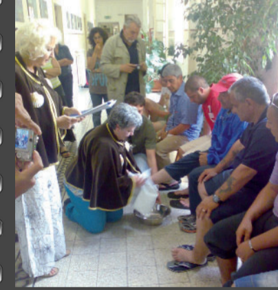
La lavanda dei piedi ai pellegrini all'arrivo a Roma