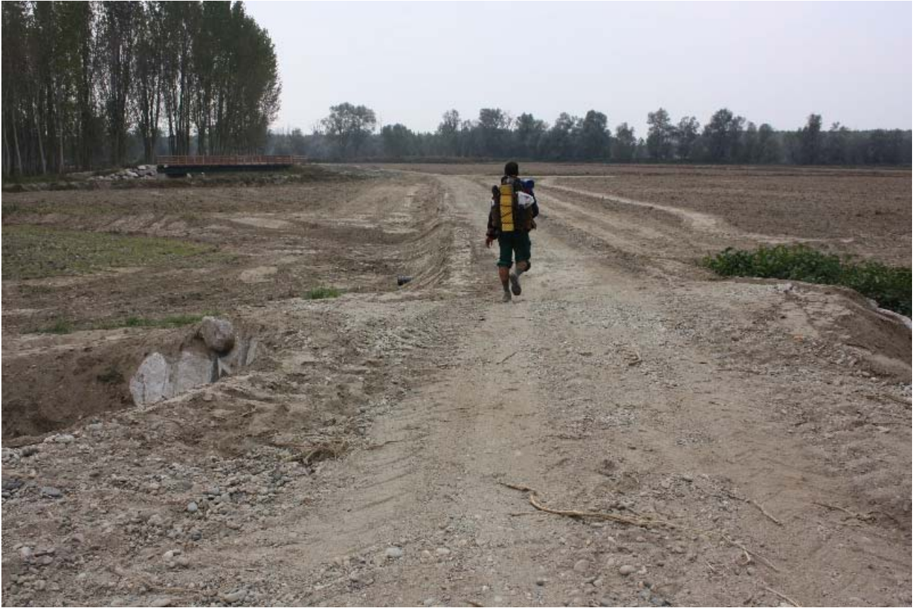
Lunedì 24 ottobre 2011 un pellegrino americano è stato tra i primi a transitare sul nuovo tratto di strada