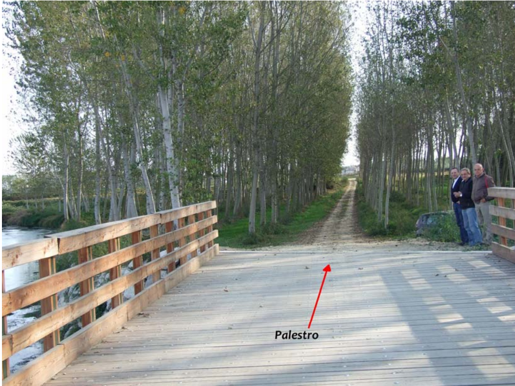
Ponte sul Crocettone